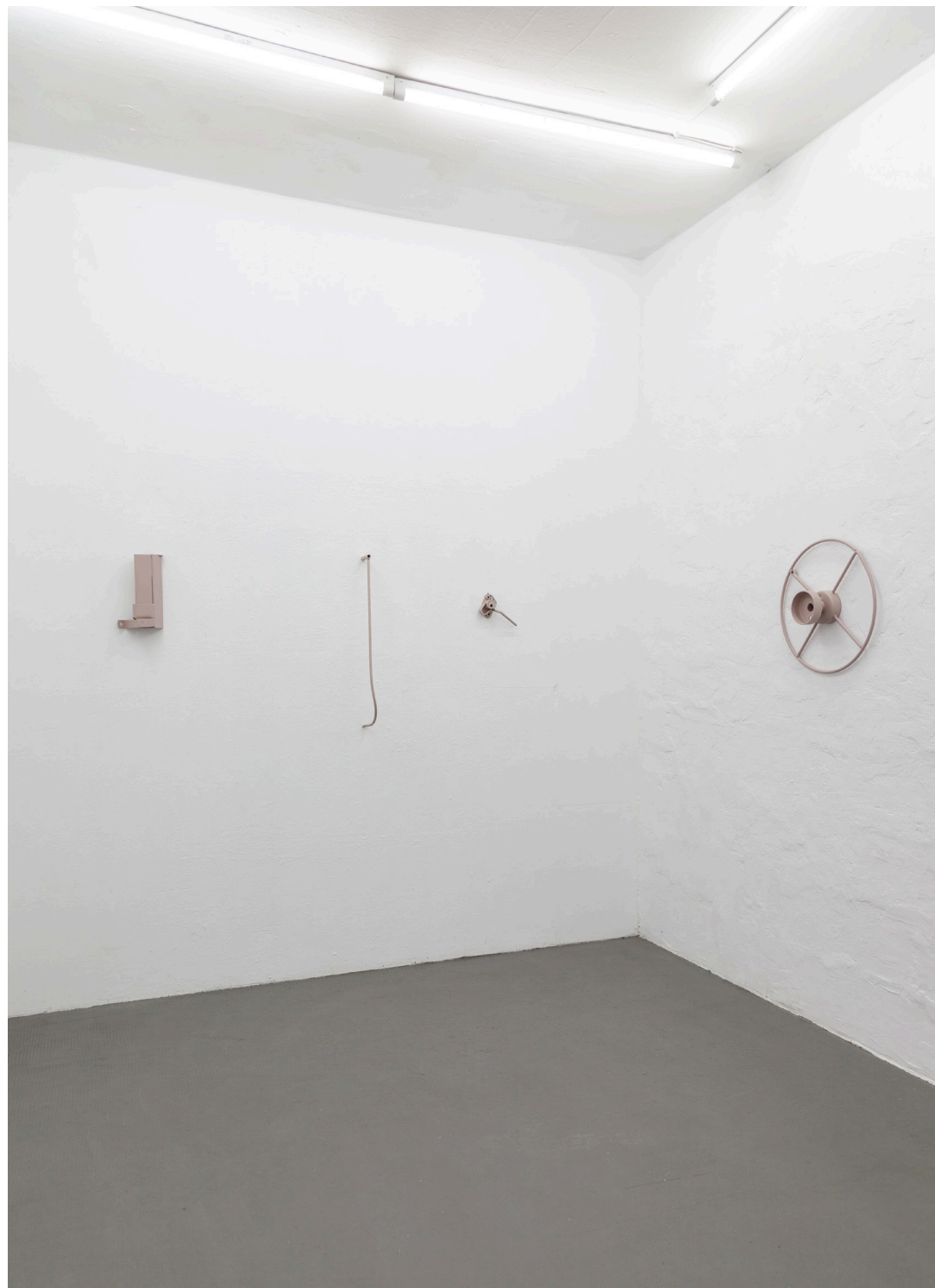
spare part #1 - #6 Edition for V8 Plattform 2023, steel, paint, various dimensions