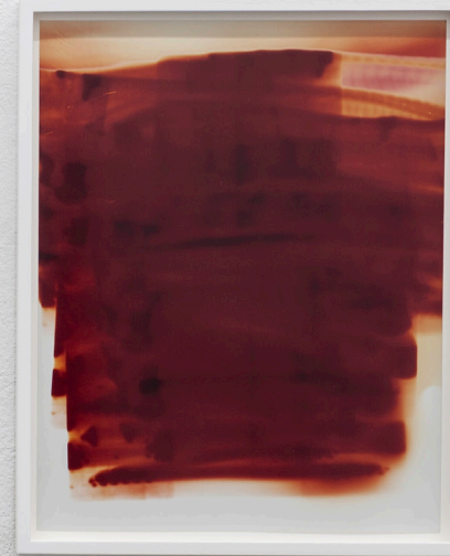
Blinded , 2023, analogue print, framed, 42.6 x 32.8 x 2.5 cm Blinded , 2023, analogue print, framed, 33 x 26.5 x 2.5 cm