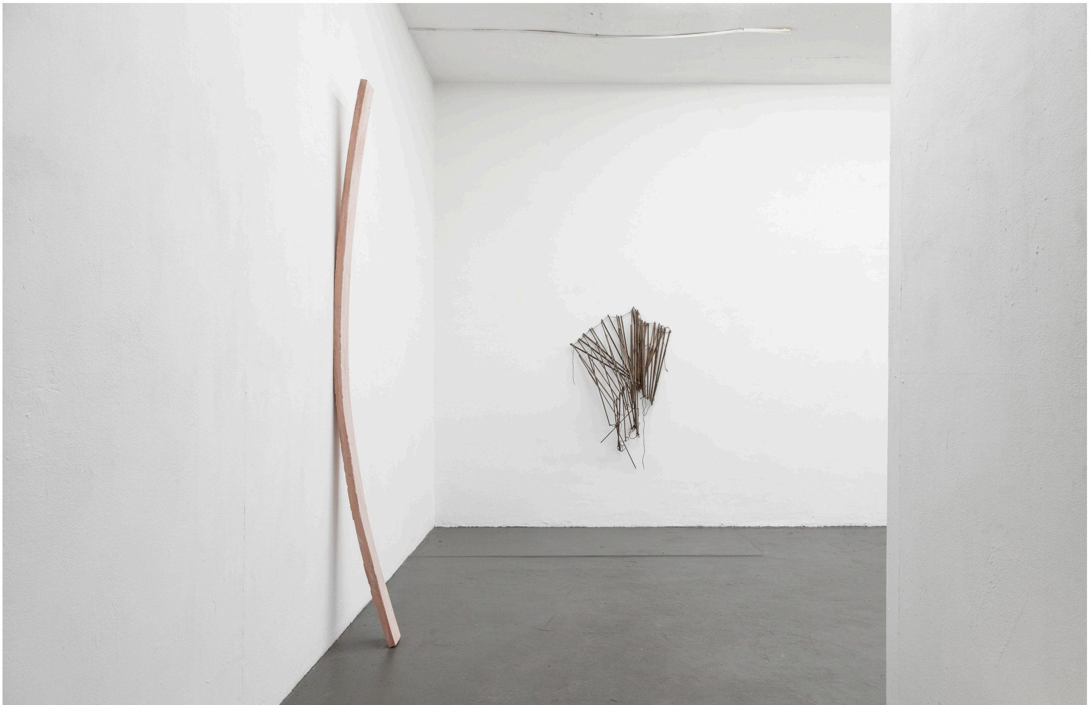
Caution , 2023, schamotte cast, 250 x 12 x 25 cm Laissez-faire , 2012/2023, wood, cord, 120 x 80 x 30 cm