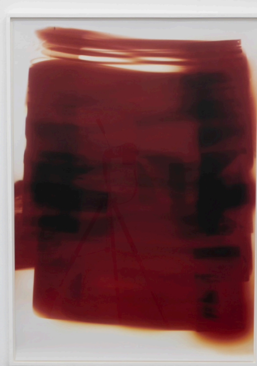
Blinded , 2023, Lambda print, framed, 125 x 90,5 x 4 cm