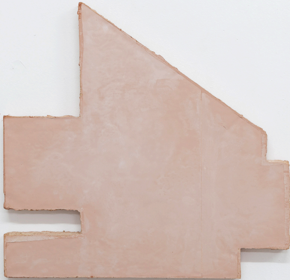
Token , 2023, schamotte cast, 42 x 44 x 3 cm