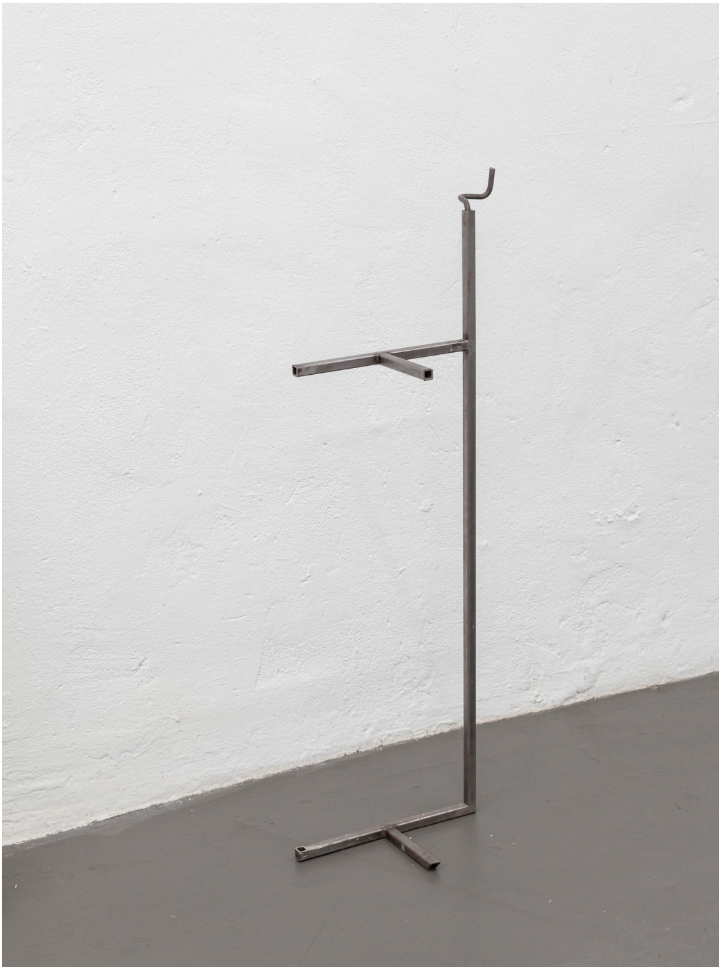
Moment , 2023, steel, 96 x 36 x 18 cm